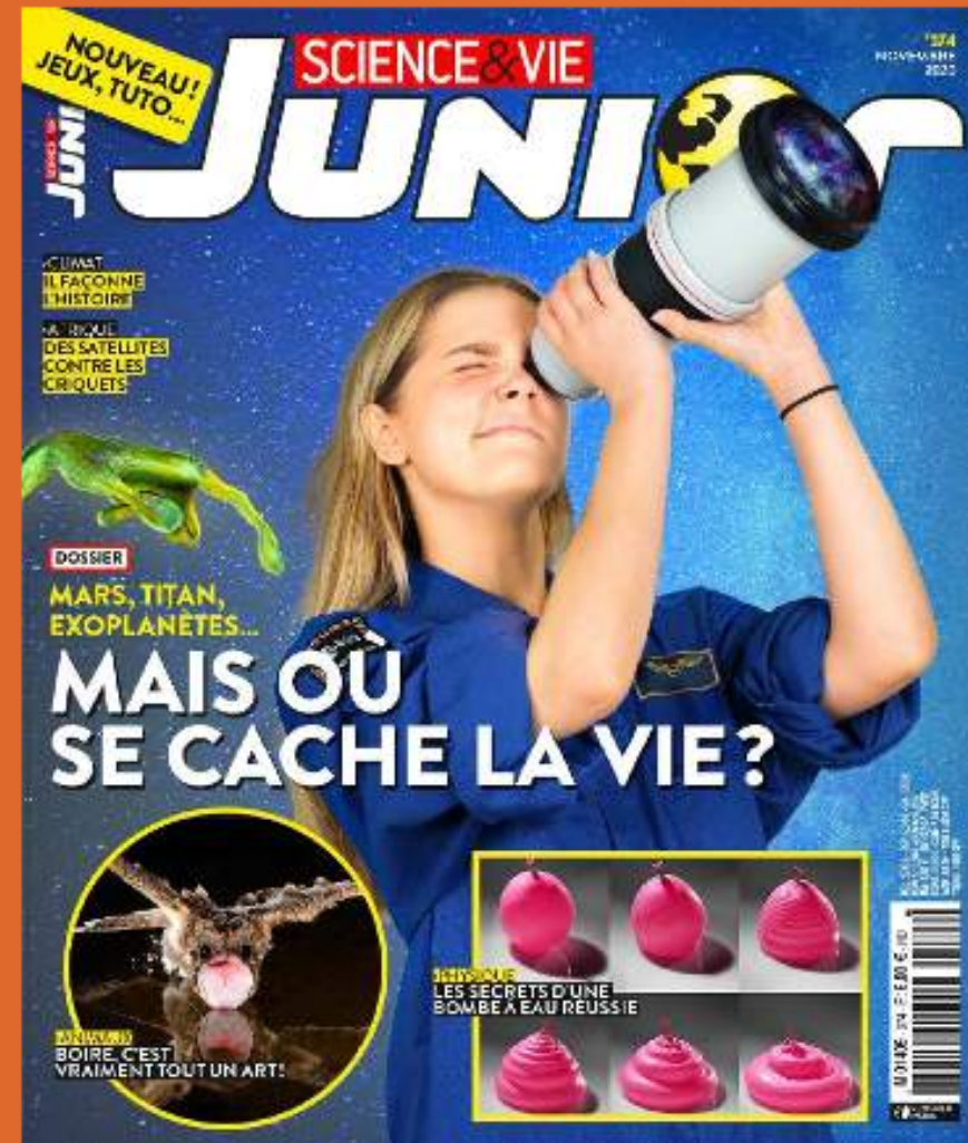
Science & Vie Junior , octobre 2020.