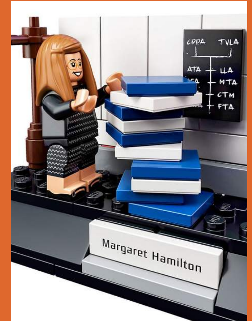
Women of NASA par LEGO, 20158.