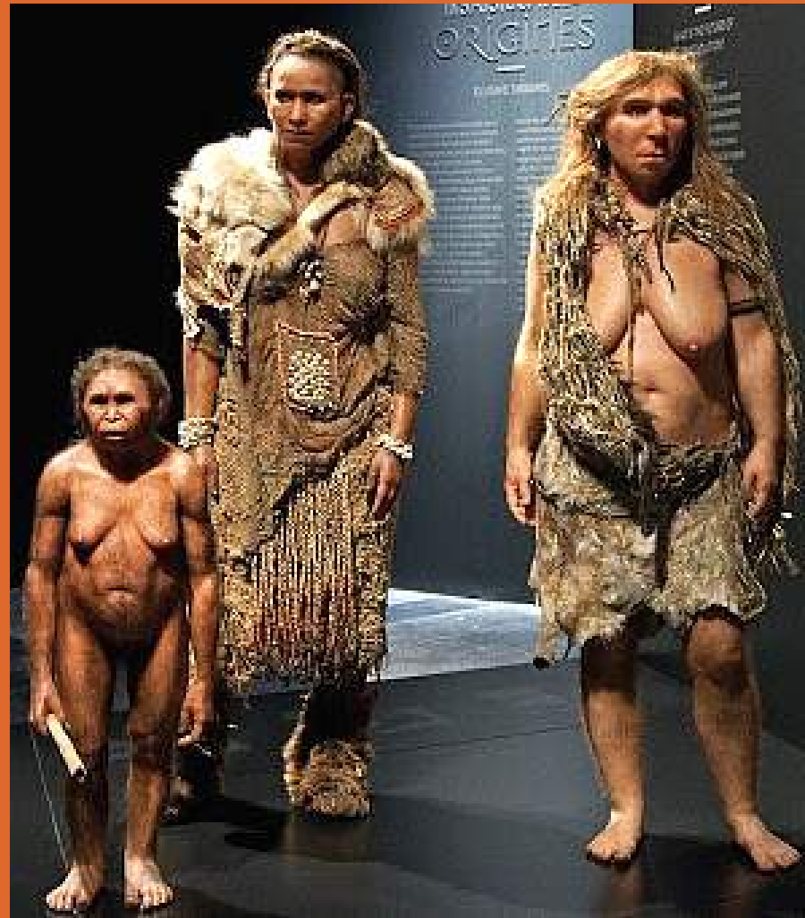
Femmes florès, sapiens et néandertalienne. Elisabeth Daynès pour le Musée des Confluences de Lyon (2013).